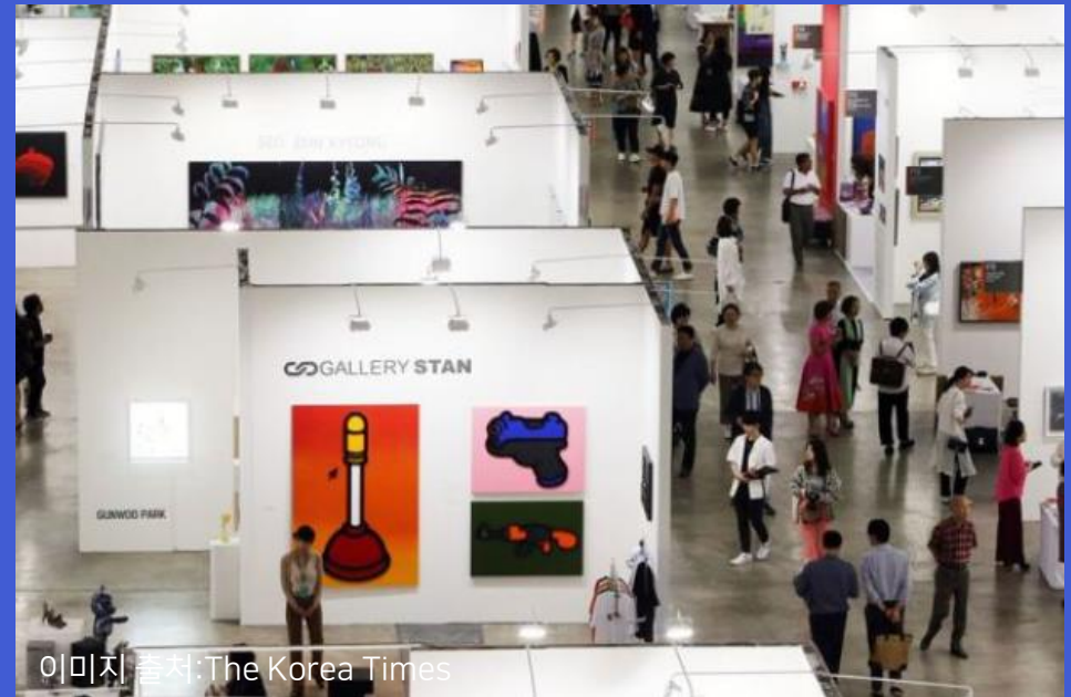
키아프 서울 (KIAF SEOUL)